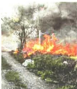
900 m 2 de végétation sont partis en fumée à Grisy-Suisnes.

Selon le maire, Jean-Marc Chanussot, « les occupants, qui ne devraient pas être là, ont mis le feu à un amoncellement de déchets, dans ce secteur préempté par la municipalité voici 3 ans. »