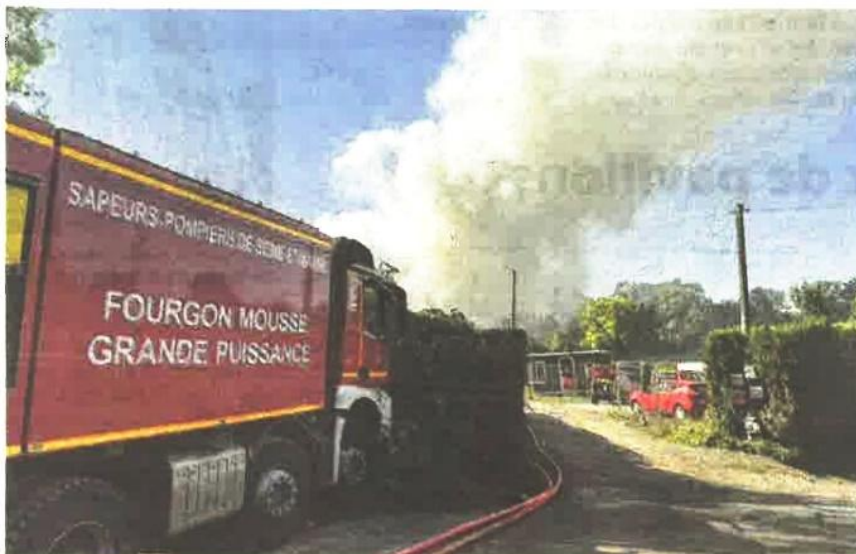
Le feu de déchets, sur le camp illícite des gens du voyage de Grisy-Suisnes, a provoqué un important dégagement de fumée.