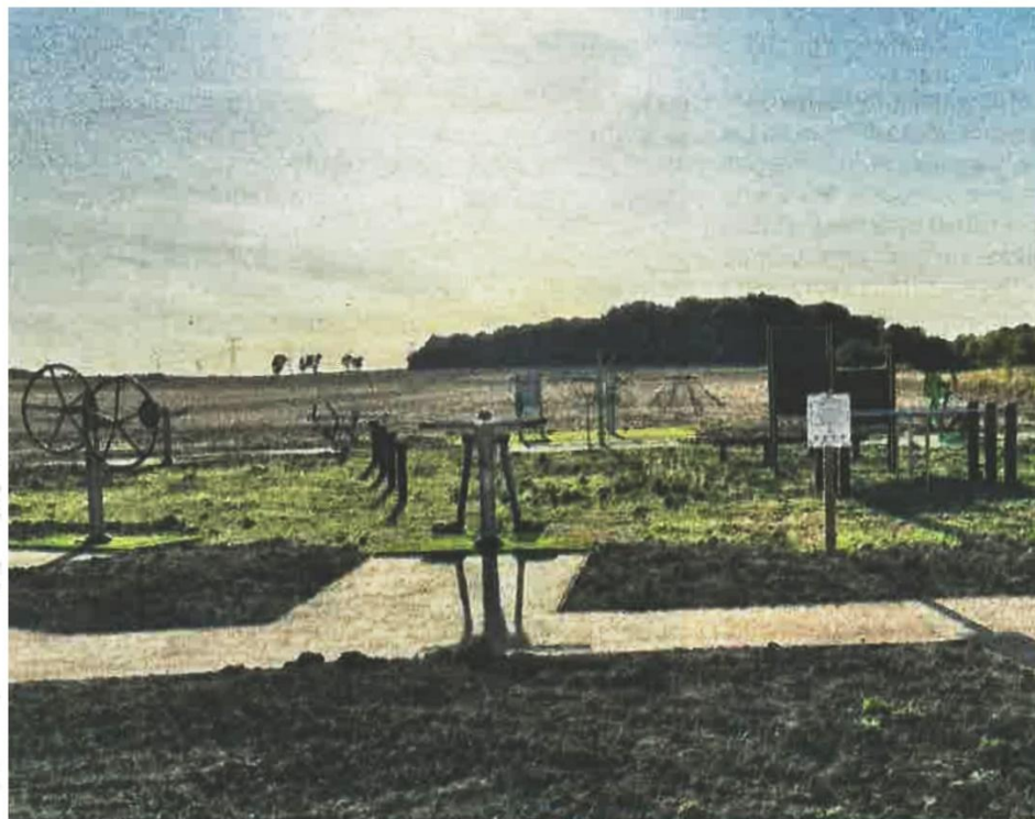
Malgré les finitions qu'il reste à apporter, le parcours de santé est ouvert à la population