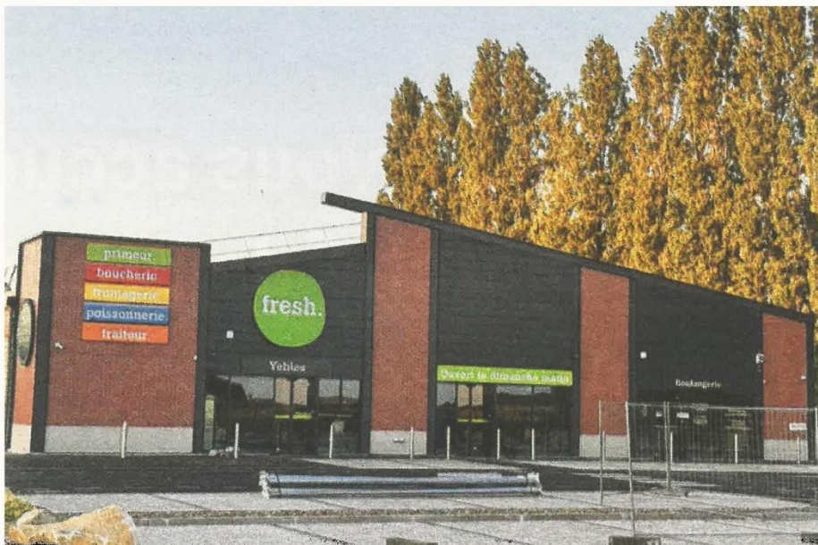
Fresh se prépare à accueillir ses premiers clients

Situé dans la zone d'activités des Portes de Yèbles, Fresh dispose d'une surface de vente 500 m² et proposera des produits frais dans ses rayons primeur, boucherie, fromagerie, poissonnerie et traiteur. Il sera ouvert tous les jours de la semaine, ainsi que le dimanche matin. La boulangerie, quant à elle, sera artisanale. Contrairement à certaines boulangeries