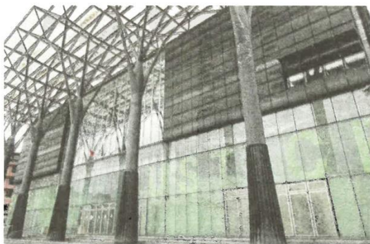
Une jeune fille a été jugée au tribunal correctionnel de Melun pour avoir frappé sa mère RSM77

Le 22 mars dernier, en fin de soirée au domicile de Grisy-Suisnes, une scène violente éclate entre les différents protagonistes. La jeune fille, en situation de détresse morale extrême depuis qu'elle a été victime d'un viol commis par des adolescents, s'apprête à se scarifier les avant-bras quand elle est interrompue par sa mère qui entend bien sûr la préserver de cet acte d'automutilation. La jeune fille se rebiffe comme c'est souvent