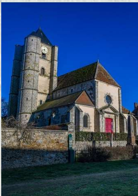
Ozouer-le-Voulgis : Eglise Saint-Martin

L'imposante église Saint-Martin à Ozouer-le-Voulgis, inscrite au Monuments Historiques depuis 1926, est un édifice de style Renaissance bâti vers 1530-1540 et remanié au début du 18e siècle qui abrite de nombreux objets d'art.