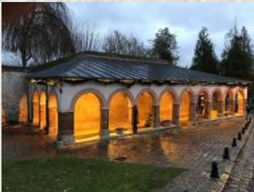
Ozouer-le-Voulgis : lavoir du Bourg