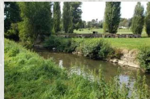
Ozouer-le-Voulgis – L'Yerres près du village

Une agréable petite randonnée autour d'un village installé sur un coteau de l'Yerres. Après avoir vu des champs, le village sous différents angles vous traversez un bois où subsistent de nombreuses traces d'exploitation de carrières.