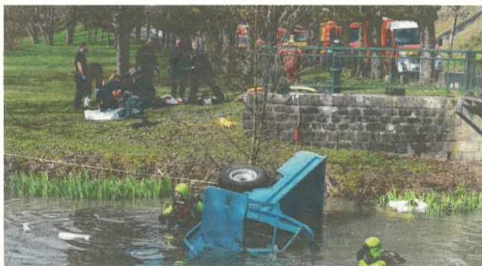
D'importants moyens ont été déployés pour secourir le conducteur dont le véhicule est tombé dans un bras de Seine, à Fontaine-le-Port

L'embarquée a provoqué une sortie de route de la voiture qui a heurté une barrière et terminé sa course dans le ru du Châtelet, un bras de la Seine. À l'arrivée des pompiers,