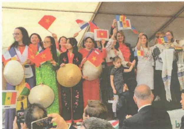
Les 23 et 24 mars, la 5 e édition du Week-end de la Francophonie de Yèbles mettra à l'honneur le Vietnam et plus de 40 pays francophones

continent américain à l'Europe, de l'Asie aux Antilles, plus de quarante pays seront présents,