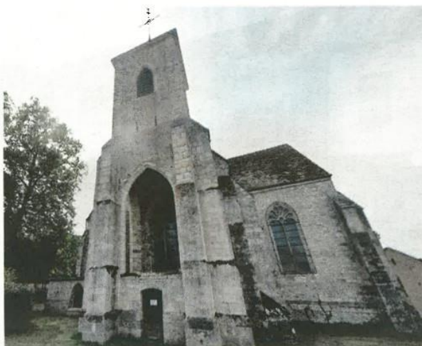
L'église Sainte-Osmane, à Féricy, a été un lieu de pèlerinage. Google - J. L. B. 77

En remerciement, la reine offrit à l'église, où officiait l'abbé Florentin, un tabernacle en bois doré et un maître-autel. Les dé-