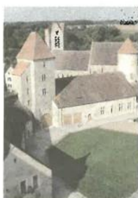
Le château de Blandy-les-Tours va être meublé et accueillera une nouvelle salle d'exposition.

Elle permettra de comprendre l'évolution du château à travers les siècles, en évoquant son histoire dans sa globalité. La construction d'un château médiéval sera présentée au public, tout comme les caractéristiques architecturales du monument.