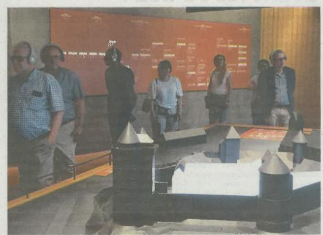
Un parcours en immersion sonore au cœur de l'histoire du château de Blandy

« C'est en effet très surprenant d'être ainsi embarqué au cœur de l'histoire du château, souligne-t-elle. La qualité audio et la technologie du casque sont remarquables et permettent cette immersion historique. On sent