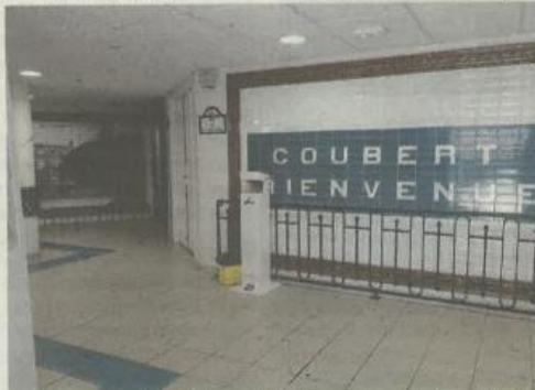
Le futur centre de santé prendra forme au rez-de-chaussée de l'Ehpad