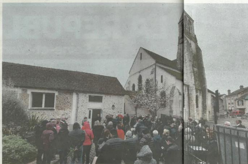
Une mobilisation s'est tenue le 2 avril à proximité de l'église, fermée depuis 2010. JL.R55677

Mais au cours du sondage des murs de l'église, l'architecte habilité par les Monuments historiques s'est aperçu que des creux entre les pierres devaient être préalablement rebouchés. « Les études ont démontré qu'il fallait utiliser du liant à divers endroits des murs du bâtiment. Suite à ces injec-