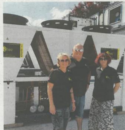
Transition écologique oblige, Abac Location a investi dans des climatiseurs moins gourmands en électricité MBRSM77

Car depuis sa création, en 2003, la société seine-et-marnaise a fait du chemin. Du Minitel (le nom Abac a été choisi pour apparaître en premier sur l'annuaire !) jusqu'à la pandémie de Covid-19, véritable tournant, elle a su s'adapter. « Ça nous a fait rentrer dans un nouveau monde, admet le chef d'entreprise. On fait 80% d'événementiel, donc on a été plombé par la pandémie. On a tout remis en question et on a survécu grâce à notre trésorerie. Les conséquences des attentats de 2015 nous