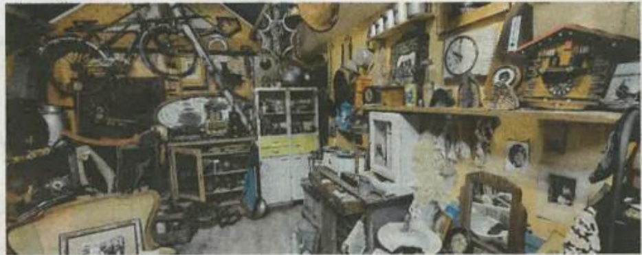
Le Grenier est rempli d'objets en tous genres, témoins du passé

Un grenier imaginaire, avec de vrais objets anciens. C'est le concept du Grenier de Saint-Ouen-en-Brie, un lieu où sont mis en scène les objets du passé, se racontent des histoires, se tissent des récits inédits ou traditionnels issus du territoire et de la mémoire locale. Derrière ces objets, il y a ceux et celles qui les ont fabriqués ou s'en sont servis. Il y a des coutumes, des savoir-faire et les traces de ceux qui nous ont précédés. Il y a des vies simples, mais aussi des légendes.