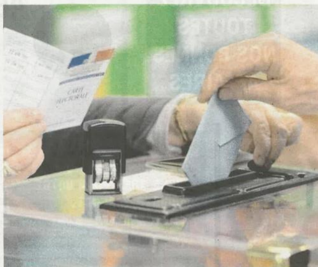
Les Guignois et Guignaises ont rendez-vous avec les urnes, les dimanches 5 et 12 mars

« Nous avons été élus pour porter un programme, ce que nous avons fait depuis 2020, et ce malgré les difficultés liées au Covid. Nous avons réussi à mettre en place des actions et à réaliser un certain nombre des engagements que nous avions pris lors de la campagne électorale. C'est fidèle à ses engagements, et aguerri de ses trois premières années de mandat, que j'ai décidé