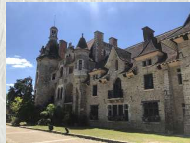
Le château des Dames

Agréable déambulation au travers le Châtelet-en-Brie, petite ville briarde dominant la source qui serait, il y a fort longtemps, la raison de son installation.