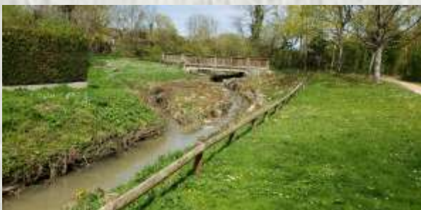
Le ru du Châtelet dans le parc Ste Reine

A partir de 1998, la commune du Chatelet-en-Brie en devint le propriétaire et le transforma en lieu culturel, après d'ultimes rénovations.