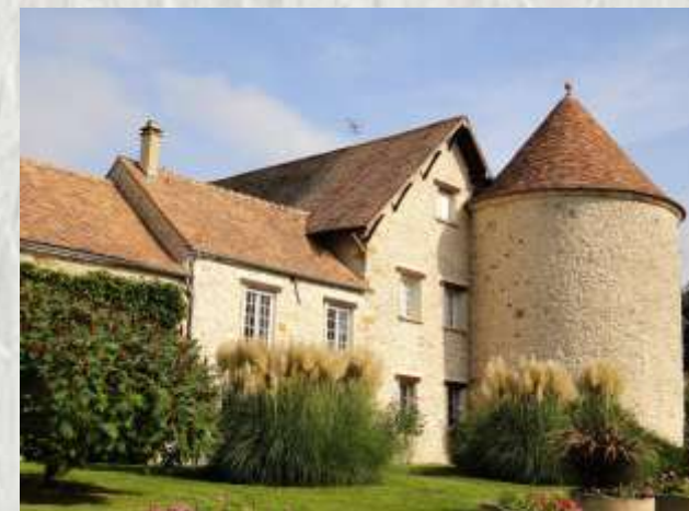
Ferme du château Valence-en-Brie

Les moines mirent en valeur les richesses de la forêt d'Échou et des champs environnants avec leurs céréales. La ferme de la Recette en témoigne, parmi les fermes fortifiées de la région.