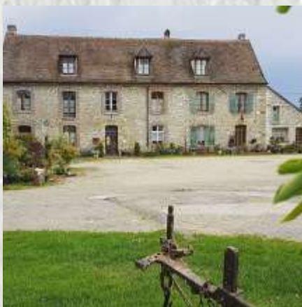
Échou : Ferme de la Recette

A Échou, la ferme de la Recette possède un ancien colombier au toit à pans coupés. Au Moyen Age, les moines y engrangeaient leur récolte bien avant qu'elle ne deviennent une ferme-auberge. Le bois d'Échou recèle deux chênes remarquables près du carrefour du Pavé-de-Boulains. La faune (faisans, lapins de garenne, sangliers, cerfs et biches) et la flore, protégées y sont diversifiées. Le gouffre de La Sablière à l'est du bois fait partie des curiosités naturelles.