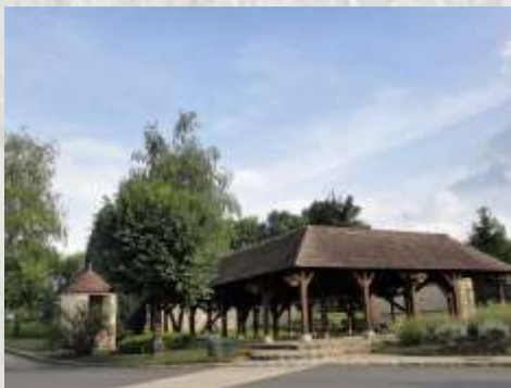
Valence-en-Brie : lavoir

Le balisage de l'itinéraire que vous empruntez est réalisé et entretenu par les 300 baliseurs du comité départemental de la Randonnée Pédestre de Seine et Marne (Codérando 77). Il fait partie des 4 900 km de chemins de promenade et de randonnée existant sur le département.