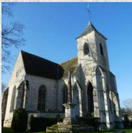
Eglise de Féricy

Le culte de Sainte Osmane fut introduit à Ferriciac dit aussi Ferriciacus, à l'époque des premiers rois carolingiens (VIII e et IX e s.) lorsque le roi attribua ces terres à l'abbaye de Saint-Denis. L'église, édifée aux XI e et XII e s., reçut des reliques supposées de la sainte en 1405. Des pouvoirs de guérison et de fécondité furent également attribués à la source éponyme toute proche. Anne d'Autriche, mère de Louis XIV, puis Marie-Thérèse d'Autriche, l'épouse de ce dernier, y eurent recours. Dès lors, les pèlerinages à la source Sainte Osmane se multiplièrent tout en restant essentiellement régionaux (Fontainebleau et environs).