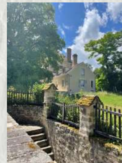
Féricy – Photo CCBRC ©

Cet itinéraire vous fait parcourir, entre champs, bois et villages, le plateau surplombant une vallée en limite de la forêt de Barbeau, forêt qui fait face à celle de Fontainebleau par rapport à la Seine.