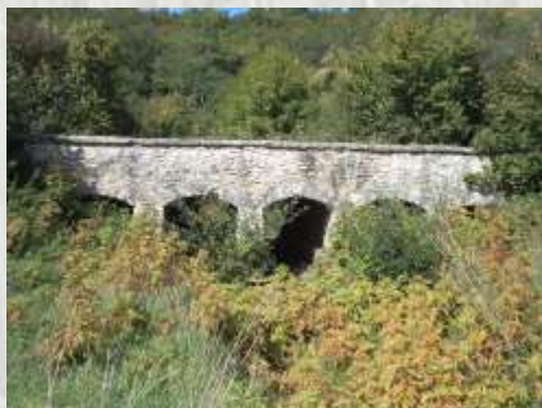
Le pont de Vallerand

Le balisage de l'itinéraire que vous empruntez est réalisé et entretenu par les 300 baliseurs du comité départemental de la Randonnée Pédestre de Seine et Marne (Codérando 77). Il fait partie des 4900 km de chemins de promenade et de randonnée existant sur le département.