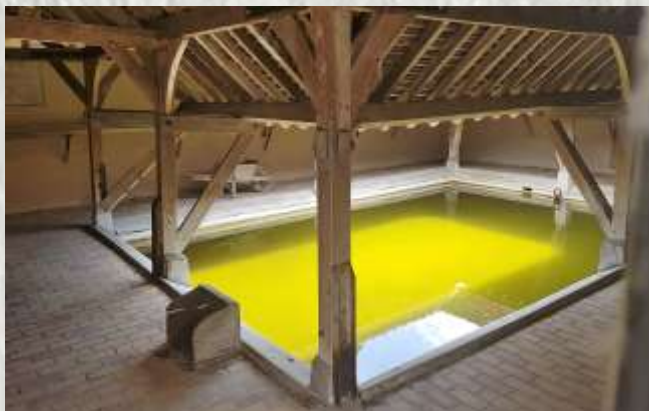
Le lavoir

Le balisage de l'itinéraire que vous empruntez est réalisé et entretenu par les 300 baliseurs du comité départemental de la Randonnée Pédestre de Seine et Marne (Codérando 77). Il fait partie des 4900 km de chemins de promenade et de randonnée existant sur le département.