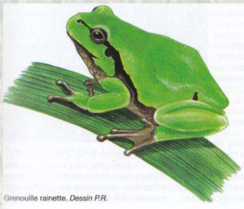
Grenouille rainette. Dessin P.R.

Au centre du bourg, se trouve un lavoir dit en impluvium, construit en 1881. A l'intérieur, deux inscriptions peintes dans un style naïf rappellent qu'il est interdit de rentrer les brouettes dans le lavoir et de mettre du linge à sécher sur les jambes de force.