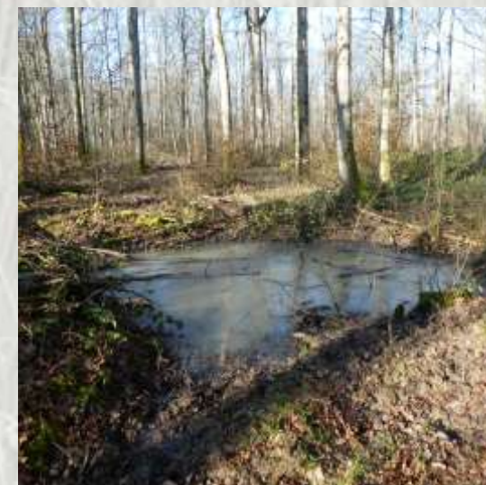
Mare près d'Echouboulain

Ce petit parcours mi-champêtre, mi forestier vous donne un aperçu des abords du massif forestier de Villefermoy, au cœur de la Brie humide, où bois et champs sont intimement imbriqués.