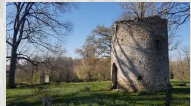
Domaine d'aiguillon

Le cours d'eau dont cet itinéraire bucolique vous fait parcourir de part et d'autre le vallon porte un nom source de confusion : le ru d'Ancoeuil. Un peu avant Blandy-les-Tours, il se nomme l'Ancoeur puis, après la traversée du parc de Vaux-le-Vicomte, l'Almont.