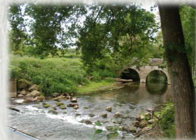
L'Yerres avant Argentières

Ce parcours vous permettra de découvrir la vallée de l'Yerres et quelques villages briards loin de l'agitation moderne.