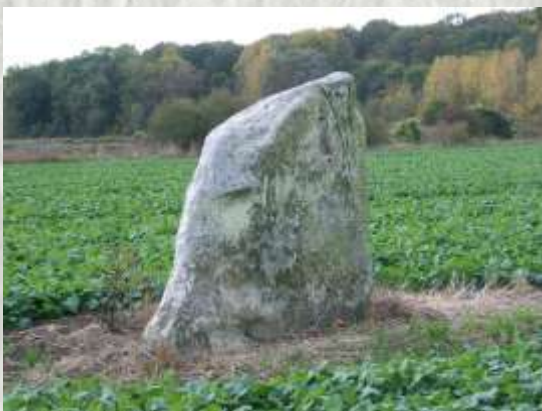
Pierre Couvée, menhir Courtomer

Le menhir, ayant échappé aux diverses menaces de destruction depuis 50 siècles, fut classé Monument Historique le 5 janvier 1971.