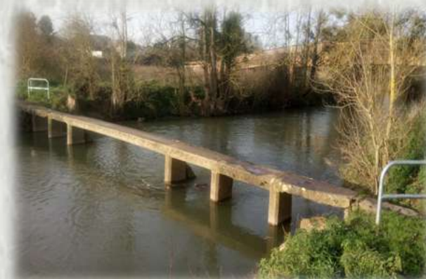
L'Yerres- ancien pont d'une seule dalle (perré) doublant un gué

L'Yerres est certainement l'une des rares rivières de France à se traverser encore à gué. Une expérience surprenante à réaliser. Préférez-vous le pont ou marcher légèrement dans l'eau ?