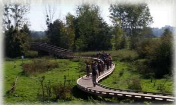
Soignolles : nouvelle passerelle sur l'Yerres

L'Yerres est une petite rivière imprévisible et fréquemment en crue. Tantôt large lors de ses débordements, tantôt étroite, elle se franchit à Soignolles-en-Brie par trois gués, praticables en dehors des périodes de crue, et par un grand pont. Les gués sont bien connus des randonneurs. Autrefois l'indication de leur emplacement était précieuse pour la marche. Ils étaient déjà répertoriés au XII ème siècle dans le Codex Calixtinus (ou Livre de Saint Jacques) pour les pèlerins de Compostelle. Les ponts étaient plutôt rares, les gués restaient le moyen le plus facile pour traverser les rivières. Encore fallait-il les connaître et qu'ils soient soigneusement entretenus. Autres témoins de cette histoire d'eau : les lavoirs et les moulins souvent tout proches des précieux gués.