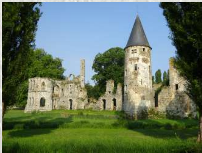
Le Château du Vivier