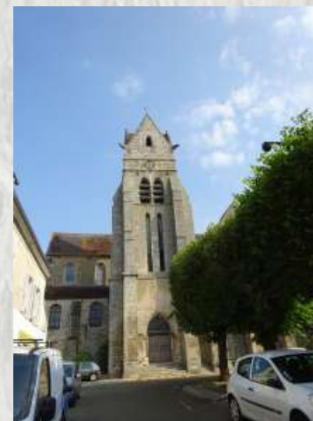
L'Église de Chaumes-en-Brie

Le Vivier, avec ses étangs et les ruines de son château, la vallée de l'Yerres dominée par le viaduc de l'ancienne voie de chemin de fer et, enfin, Chaumes-en-Brie, vous attendent sur ce circuit typiquement briard.