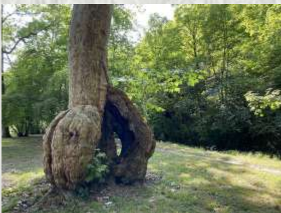
Fontaine le Port : Platanus

À Fontaine-le-Port, un groupe de 10 platanes (Platanus) est classé "arbres remarquables de Seine-et-Marne".