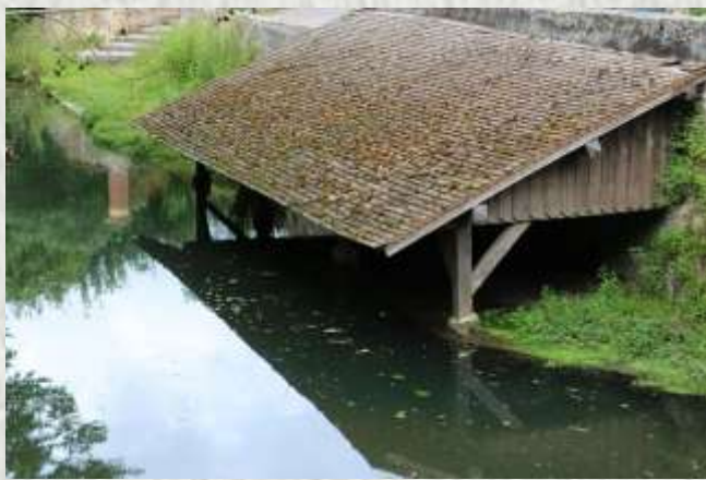
Fontaine le Port : le lavoir du ru du Châtelet

Le lavoir du ru du Châtelet à Fontaine-le-Port, situé au centre du village, était déjà répertorié en 1886 par l'instituteur Omer Thienloup.