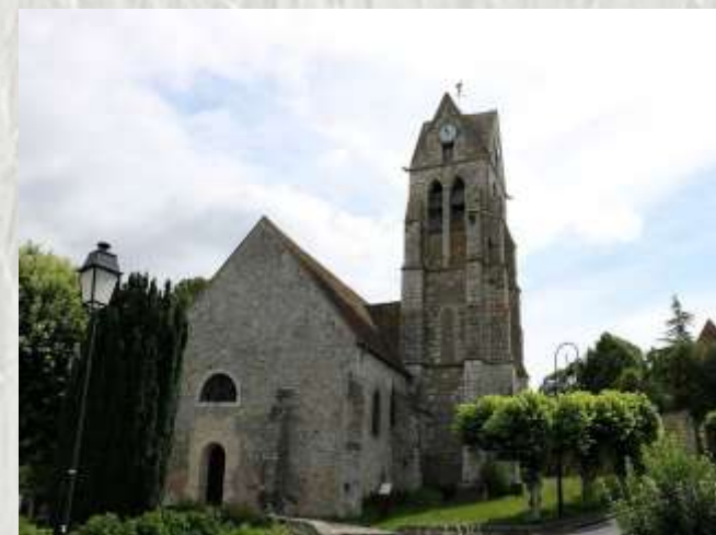
Fontaine le Port : Église Saint Martin

Le parcours en forêt domaniale de Barbeau s'effectue entre des vallons et un balcon sur la Seine, pour observer la flore des sous-bois et des champs.