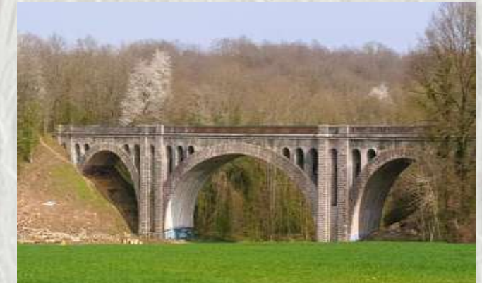
Viaduc ferroviaire

Ce circuit vous invite à découvrir une des nombreuses fermes qui jalonnent le plateau briard : la ferme de Forest. Enclose de toutes parts, ses toits pentus encadrent un porche colombier très curieux.