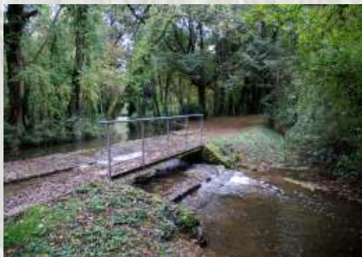
Le guésur le Bréon