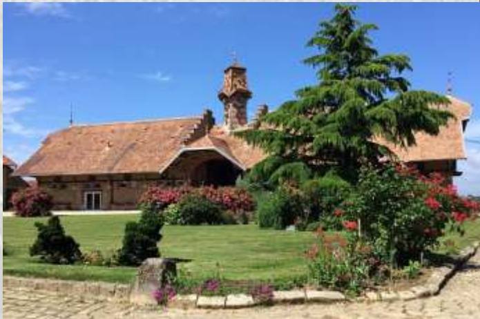
La Ferme de Forest

En 1693, Louis XIV nomme François organiste de la Cour. Celui-ci laissera une œuvre considérable, pour orgue, clavecin, musique de chambre, ainsi qu'un traité sur l'art de toucher le clavecin.