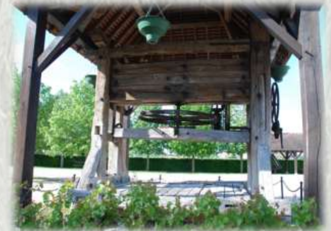
Pressoir de Machault

Souvent décrit comme « un village où il fait bon vivre », Machault est à la hauteur de sa réputation. Point de départ de cette randonnée, le village révèle un patrimoine rural témoignant du passé agricole et surtout viticole.