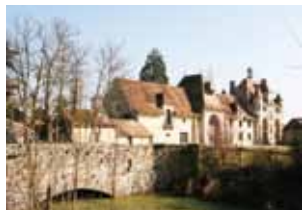
Le château et les douves