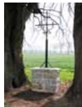
Croix de Balle